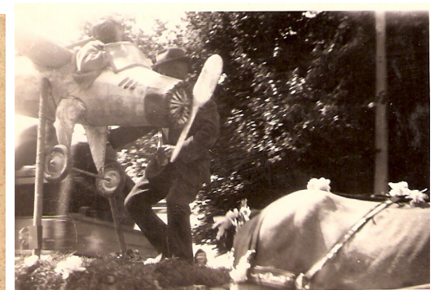
Stuca in actie