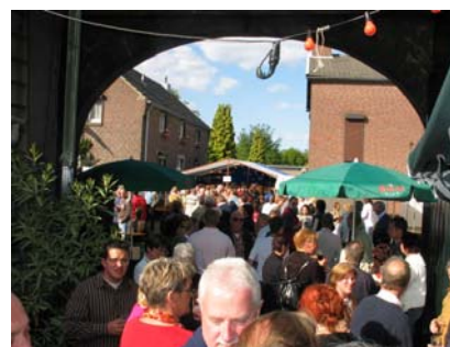
Overzicht van de zeer gezellige buffetten...